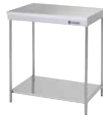
ポータブルシリーズ作業台 EKT-600 ¥18,000 (税抜)