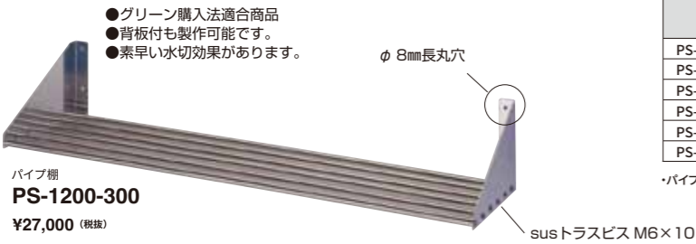
パイプ棚 PS-1200-300 ¥27,000 (税抜)