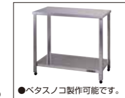
作業台 KT-900 ¥36,000 (税抜)