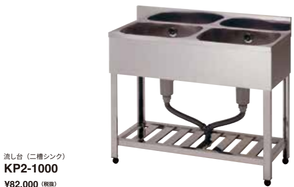
流し台 (二槽シンク) KP2-1000 ¥82,000 (税抜)