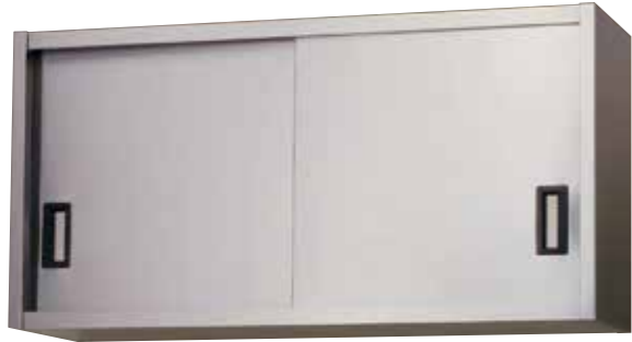
ステンレス吊戸棚 AS-1200-600 ¥87,000 (税抜)