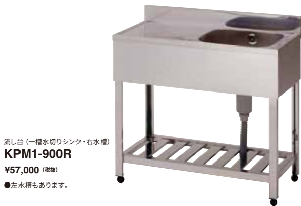
流し台 (一槽水切りシンク・右水槽) KPM1-900R ¥57,000 (税抜) ●左水槽もあります。