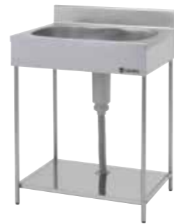
ポータブルシリーズ流し台 (一槽シンク) EKP1-600 ¥24,000 (税抜)