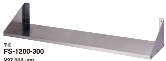
平棚 FS-1200-300 ¥27,000 (税抜)