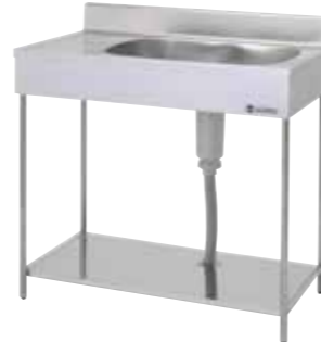
ポータブルシリーズ流し台 (一槽水切りシンク) EKPM1-800R ¥28,000 (税抜) ●右水槽のみ