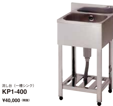
流し台 (一槽シンク) KP1-400 ¥40,000 (税抜)